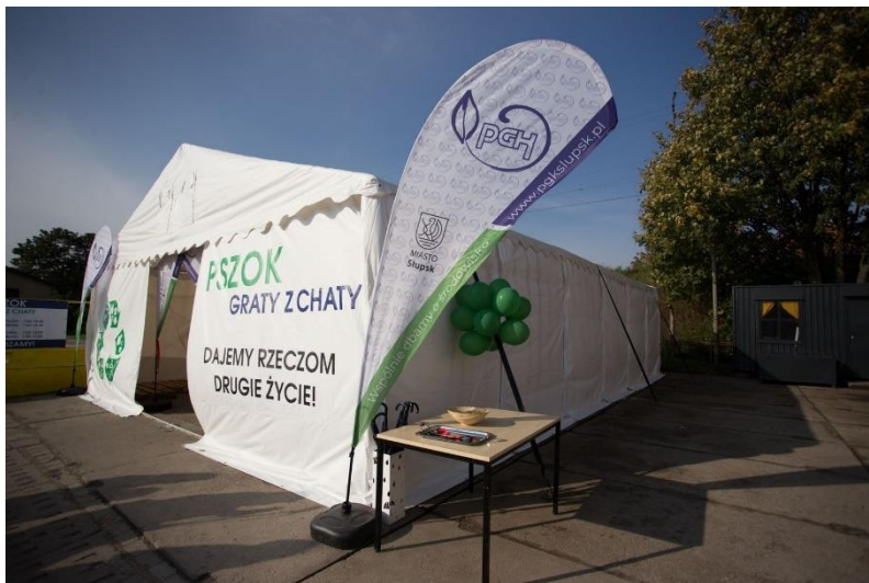
Zdjęcie 1: Punkt pn. „Graty z chaty” zlokalizowany na terenie Punktu Selektywnej Zbiórki Odpadów Komunalnych przy ul. Bałtyckiej 11A w Słupsku.